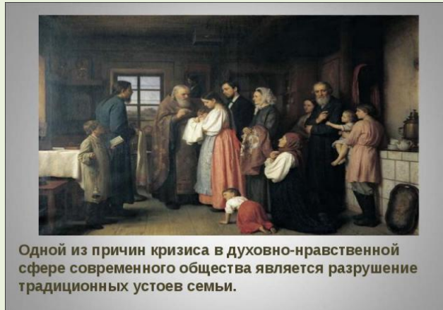
Одной из причин кризиса в духовно-нравственной сфере современного общества является разрушение традиционных устоев семьи.

Отношение к труду как добродетели может изменить нравственную атмосферу и во многих молодых семьях. Если в такой атмосфере будут формироваться характеры детей, то общество в конечном итоге будет нацелено на созидание, а рвачество, делячество, эгоцентризм вновь станут расцениваться как патология, а не норма жизни.